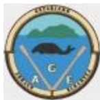
GETARIA-INDAUX- VIVEROS S. ANTON