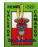
CR VALLE DE CAMARGO