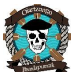
OIARTZUNGO ITSASLAPURRAK AE