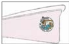
CIUDAD DE SANTANDER