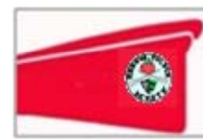
DEUSTO - TECUNI

El orden de salida será confeccionado en función a la clasificación de la liga tras la disputa de la regata Donibane Ziburuko 19. Estropadak