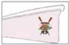
NATURHOUSE - MUNDAKA