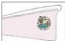
CIUDAD DE SANTANDER