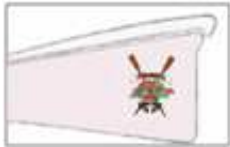
NATURHOUSE - MUNDAKA