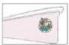
CIUDAD DE SANTANDER