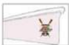
NATURHOUSE - MUNDAKA