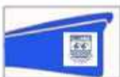
TRINTXERPE FUNERARIA VASCONGADA